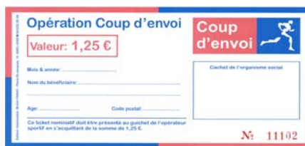
Le ticket Coup d'envoi nominatif.

Dans ce cadre, il n'est pas inutile de rappeler (encore et toujours) les quelques formalités à remplir afin de se procurer un ticket d'entrée à Sclessin avec Coup d'envoi.