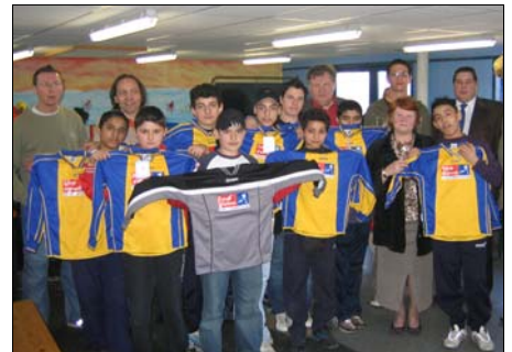
Les jeunes de la Maison Blanche de Glain avec leurs nouveaux équipements.

> Infos et renseignements au 04/220.58.59.