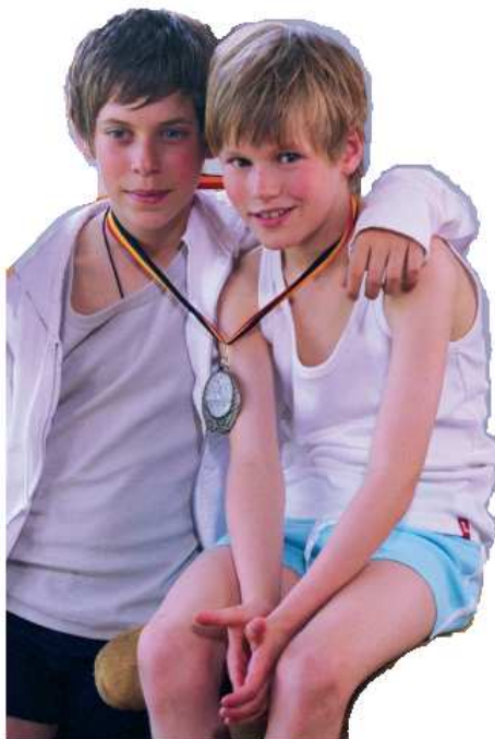
Pour les enfants de 6 à 18 ans

L'intervention pour un stage sportif est désormais fixée à 30 € maximum par enfant et par an.