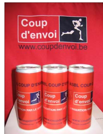
La canette « Coup d'envoi » pour un petit coup... d'envoi.

Véritable canette traditionnelle de 25 cl, la canette aux couleurs de notre ASBL contient un jus d'orange multivitaminé. Elle reçu un bel accueil auprès de notre jeune public.