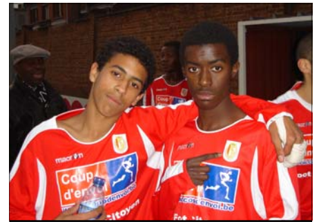
Pour l'occasion, les jeunes portent fièrement les couleurs du Standard.