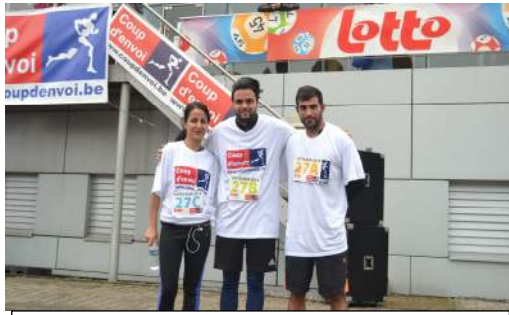
Les lauréats 2014: la « Maison Carrefour »

allait, une fois de plus, révéler une générosité sans faille dans l'effort, tout au long du circuit. Même si le classement final n'a pour nous que très peu d'importance, nous tenons tout de même à signaler que l'équipe vainqueur était mixte. La « Maison Carrefour » a donc cette fois vaincu le signe indien puisqu'aux deux précédentes éditions, elle s'était chaque fois classée deuxième.