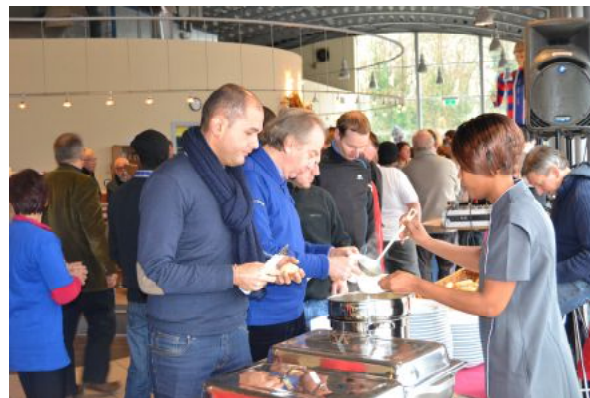
Après l'effort... la soupe !

de l'équipe. Cela favorisait donc l'esprit d'équipe plutôt que l'exploit individuel.